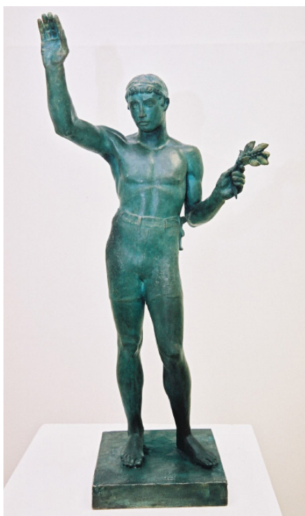
L'athlète vainqueur Plâtre patiné couleur bronze 81 x 40 x 24 cm